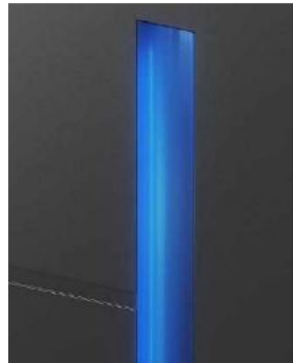
KA1 (Taschengriff) Optional mit LED Weiß oder RGB