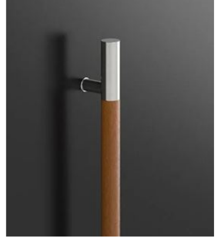
P10D (Golden Oak) 120cm / 160cm