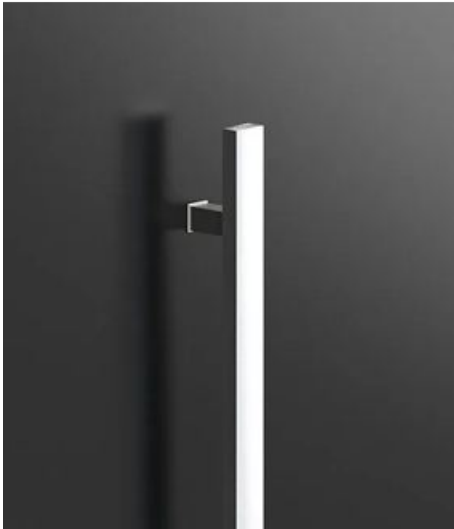
Q10 (optional mit Fingerprint) 120cm / 180cm