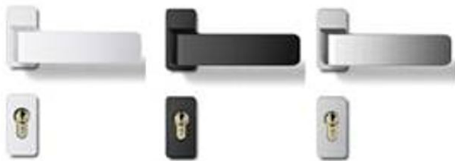
H6S26 mit geteiltem Schild Weiß, Schwarz, Silber