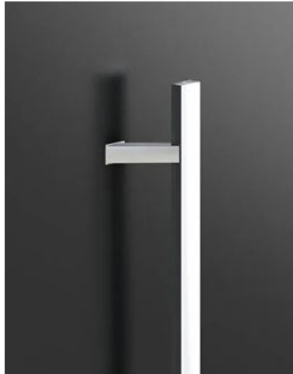
Q45RX 80cm / 120cm