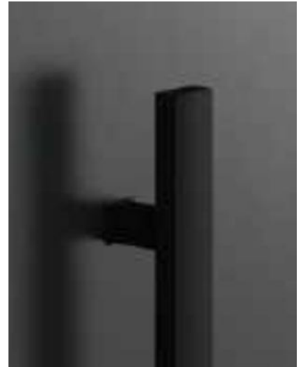
QA10 (RAL9005 Feinstruktur) 160cm