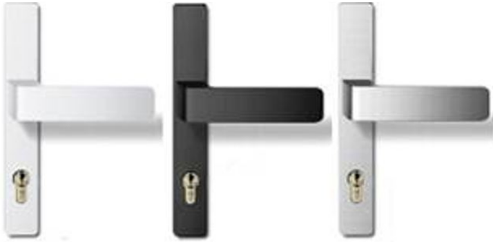
H6S26 auf Langschild Weiß, Schwarz, Silber