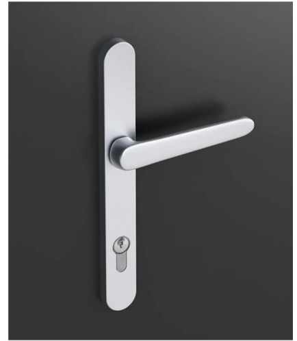
R32 mit geteiltem Schild Edelstahl