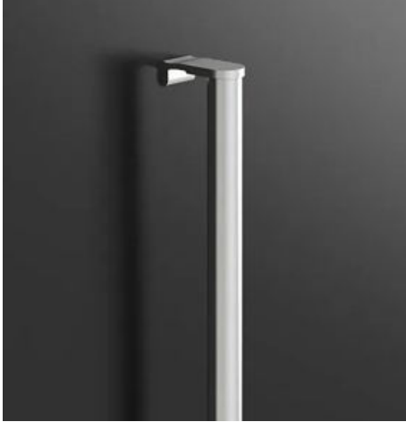
Z1 In voller Türhöhe

Folgende Griffe sind optional zu den auf den den Türdarstellungen abgebildeten Griffen verfügbar.