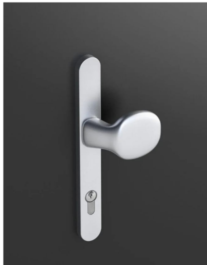
Knauf auf Langschild (Silber, Weiß, Braun, Schwarz)