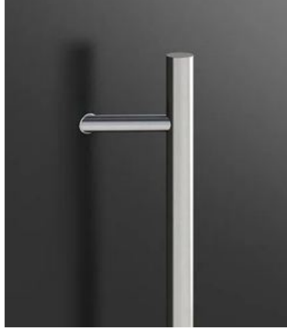
P45 58cm / 120cm / 180cm