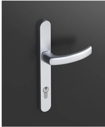
R32 mit geteiltem Schild Edelstahl