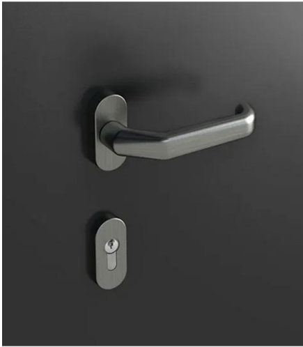
R32 mit geteiltem Schild Edelstahl