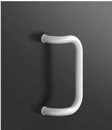
M2 (Weiß, RAL 9006, Braun)