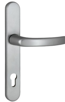
35A 2000M Aluminium