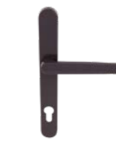
Türklinke für Rollladen