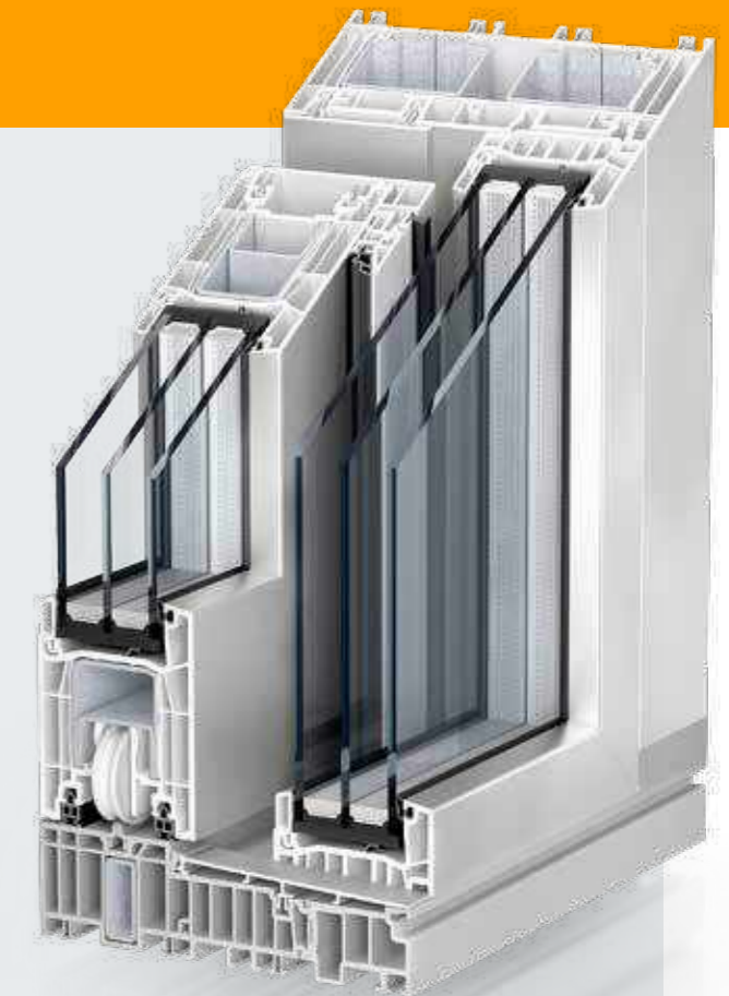
Kömmerling PremiDoor 76 Lux